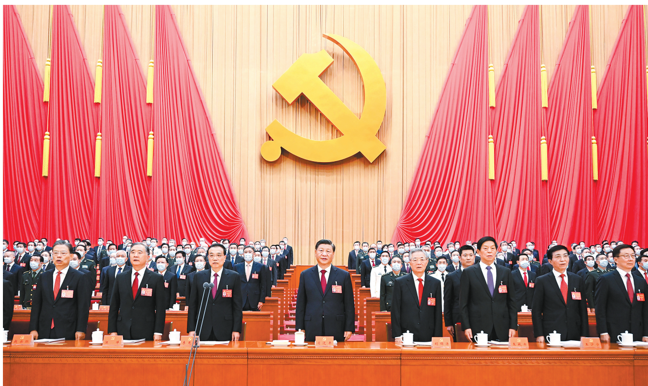
10月16日,中国共产党第二十次全国代表大会在北京人民大会堂开幕。这是习近平、李克强、栗战书、汪洋、王沪宁、赵乐际、韩正、胡锦涛在主席台上。

新华社北京10月16日电 凝心聚力擘画复兴新蓝图,团结奋进创造历史新伟业。举世瞩目的中国共产党第二十次全国代表大会16日上午在人民大会堂开幕。