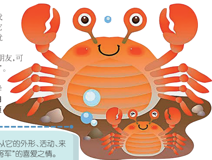
本版图片均为资料图片

作者紧紧围绕“热爱篮球”，从兴趣、外貌及性格等方面，写出了一个爱打篮球、阳光帅气的男孩特点，自然地流露出渴望继续进步的心理。