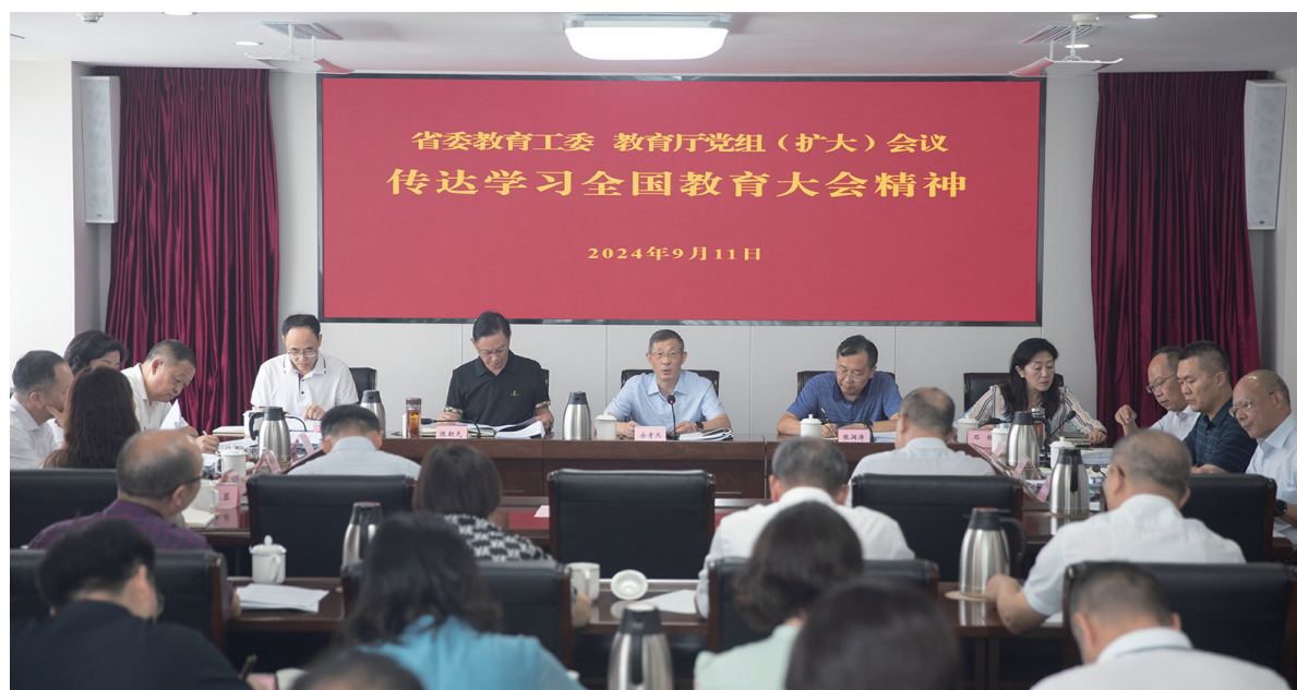
9月11日,省委教育工委、教育厅党组召开(扩大)会议,传达学习全国教育大会精神,研究贯彻落实意见。

省委教育工委、教育厅班子成员,教育厅机关各处室、直属事业单位主要负责同志参加会议。